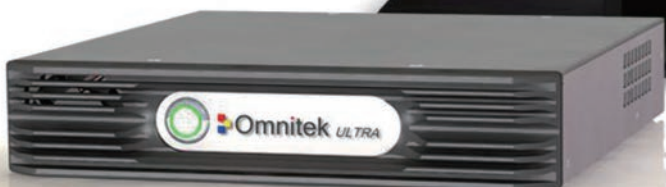
Ultra 4K Tool Box本体 (ディスプレイは含みません)